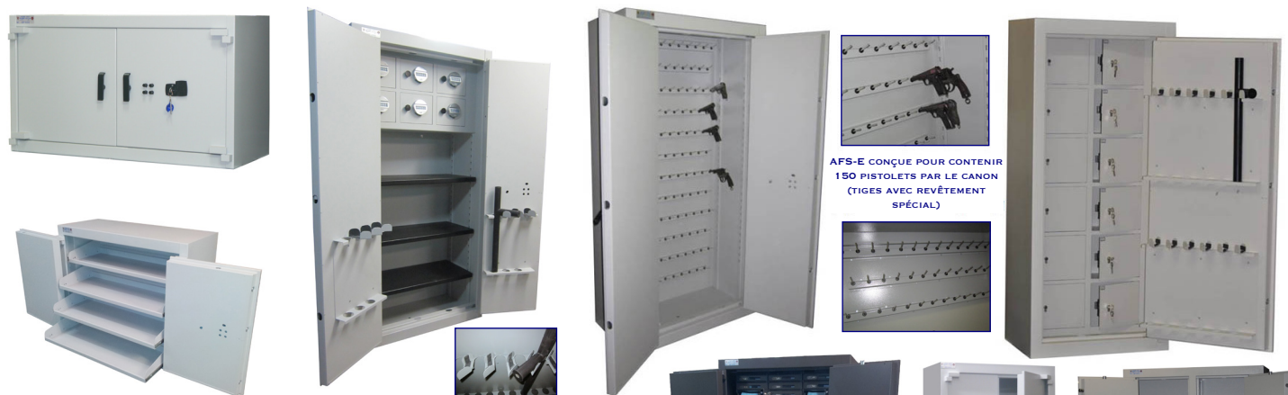
AFS-E CONÇUE POUR CONTENIR 150 PISTOLETS PAR LE CANON (TIGES AVEC REVÊTEMENT SPÉCIAL)